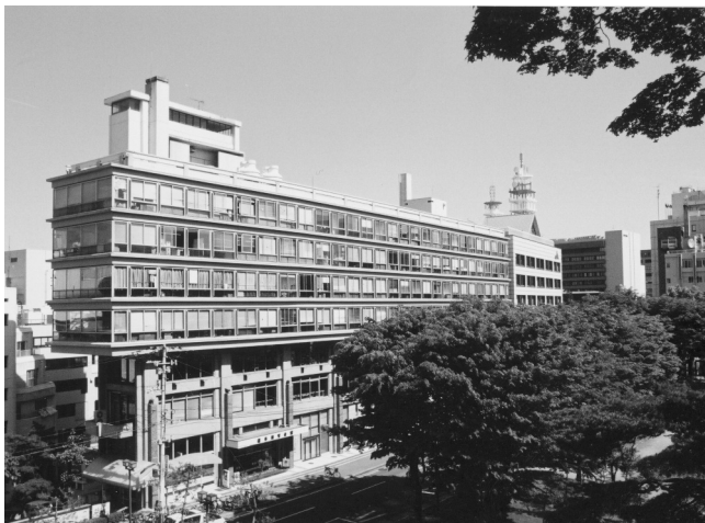
現 教育会館 (1965年落成)