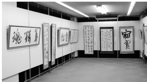
第42回岩手教育芸術祭美術展：書道