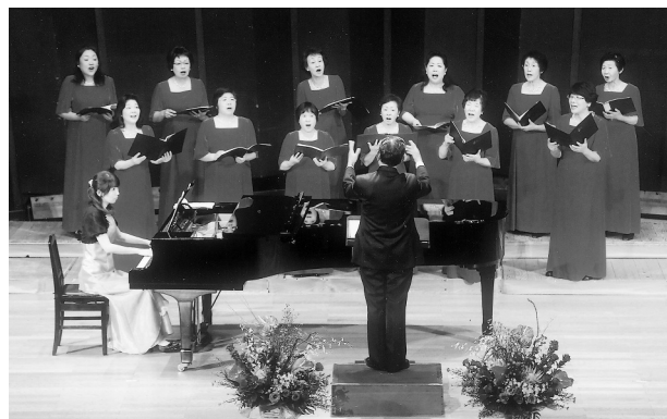
第42回岩手教育芸術祭：岩手県婦人合唱発表会